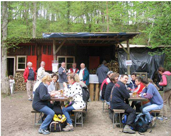
Des rencontres conviviales