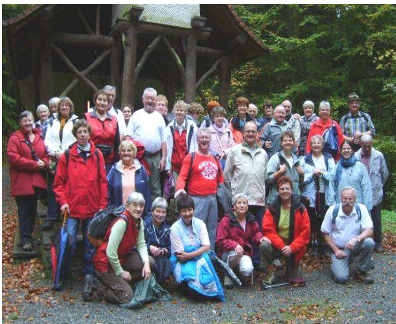
Une journée randonnée