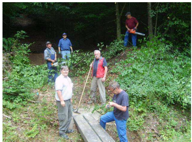
Une équipe de baliseurs au travail!