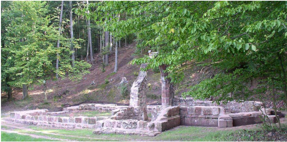
Une chapelle ruinée