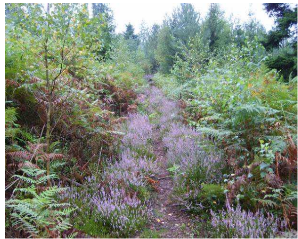
Un sentier à la fin de l'été